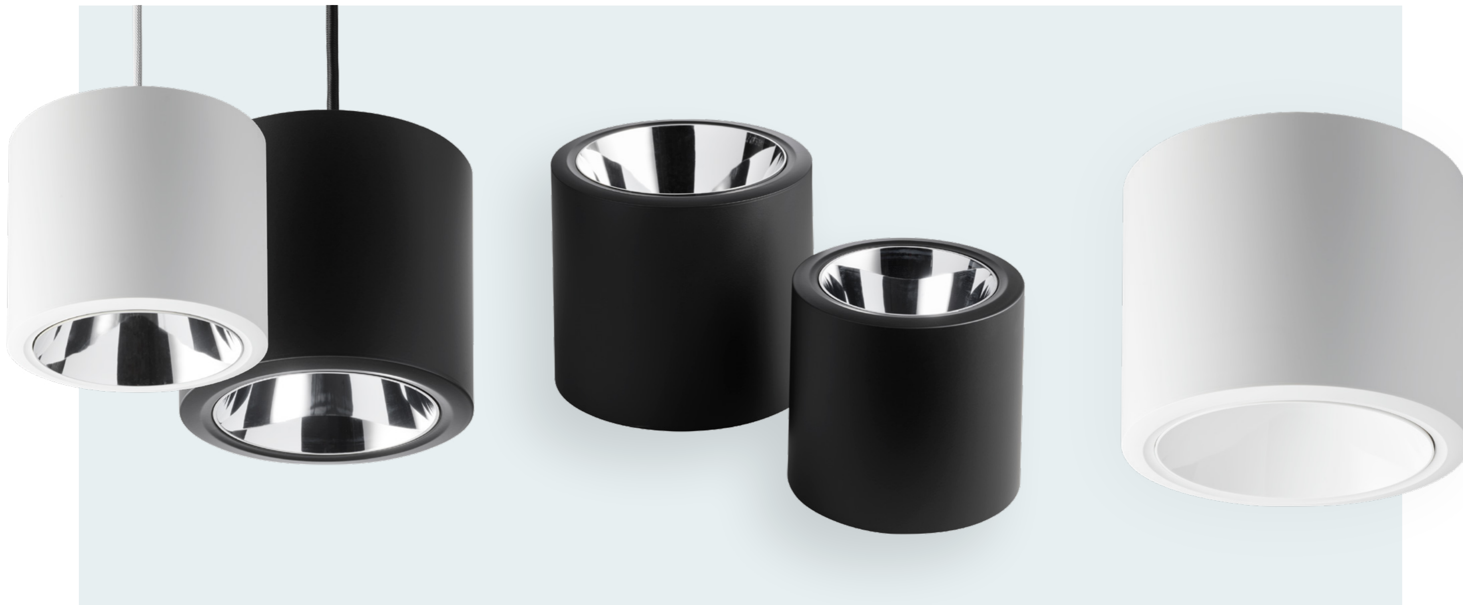
4 verschiedene Reflektoren / schwarz, weiß, silber hochglänzend, silber matt 2 Größen / Höhe: 167/197 mm, Ø 178/222 mm 2 Farben / weiß, schwarz